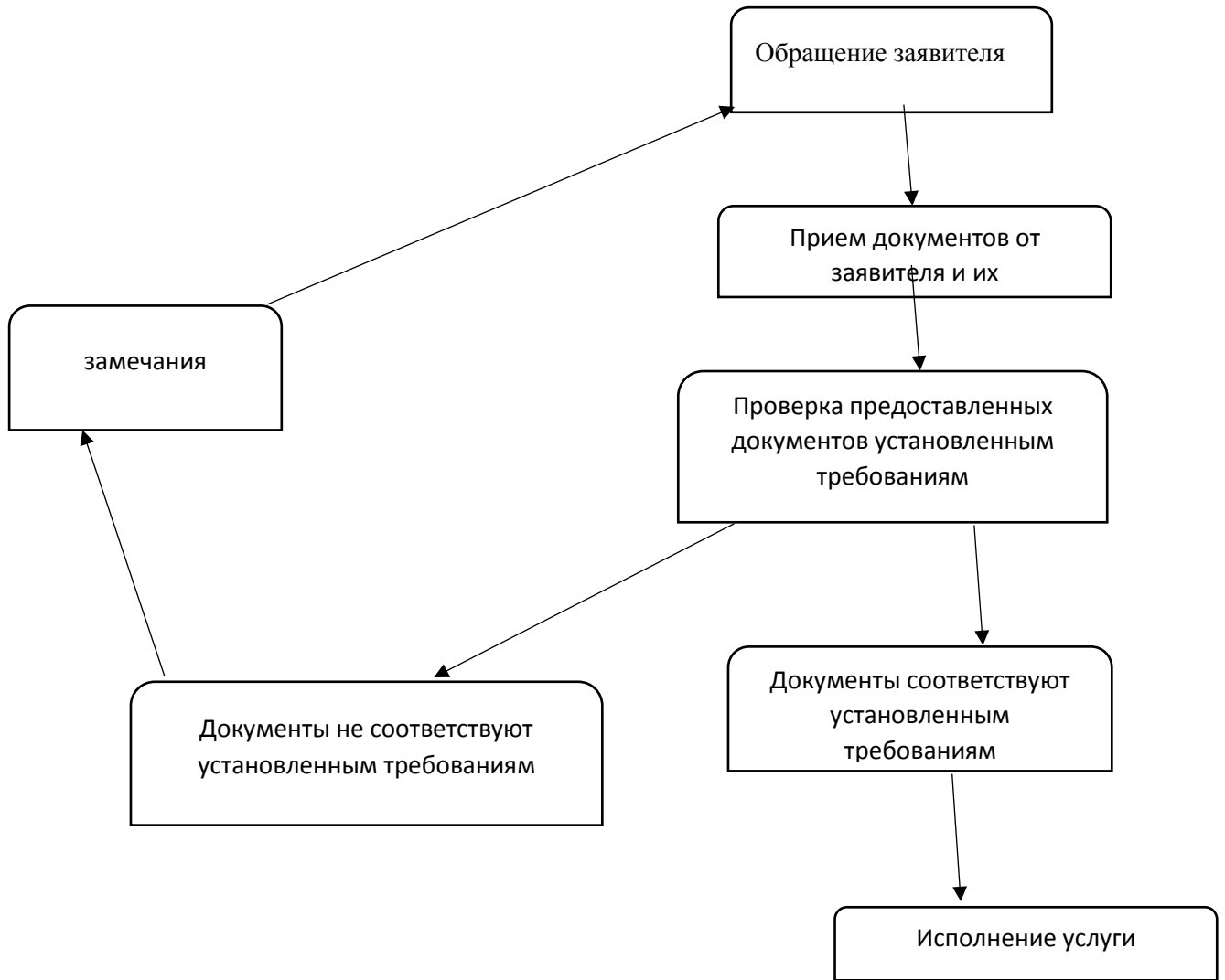
Блок – схема проведения услуги