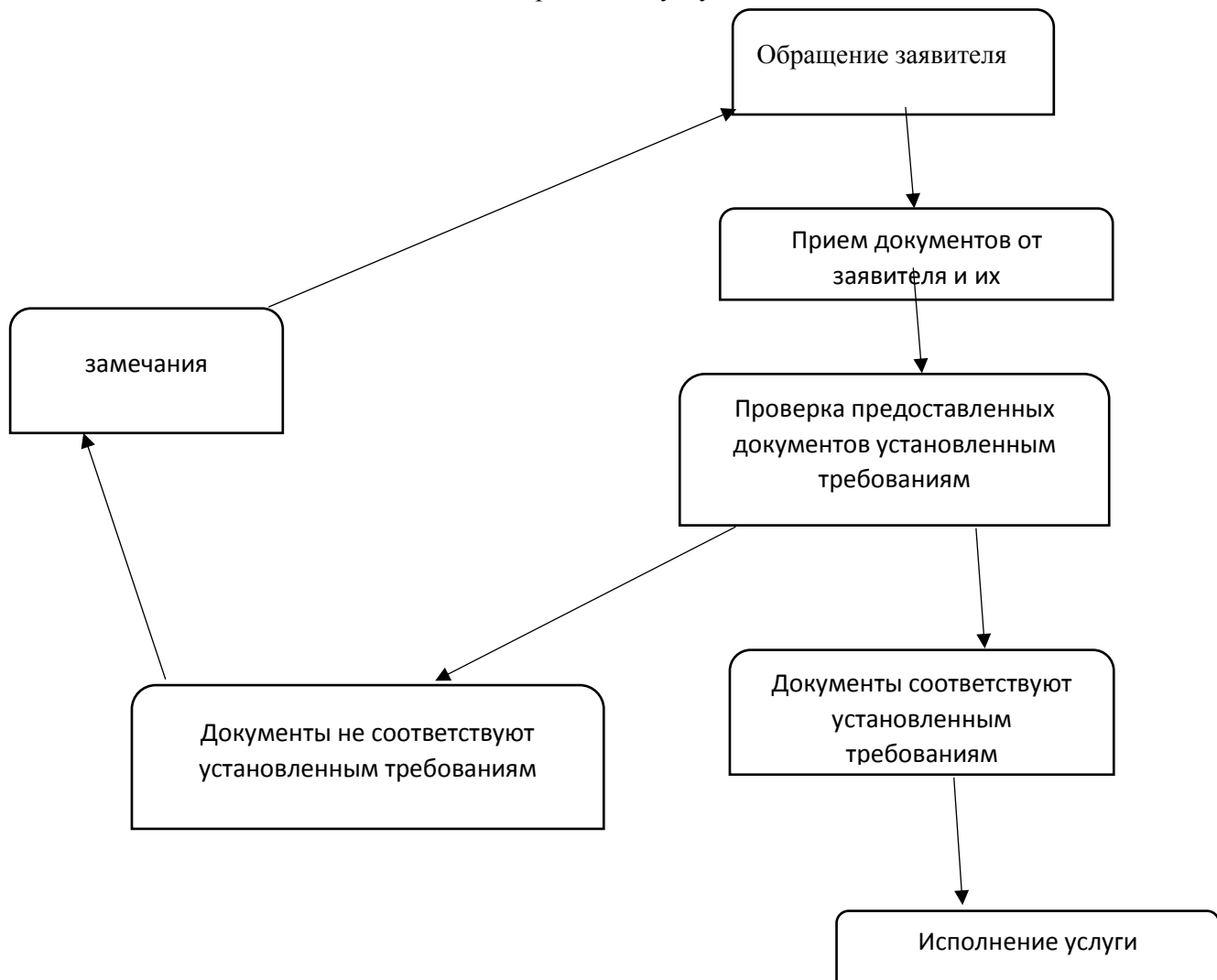
Блок – схема проведения услуги